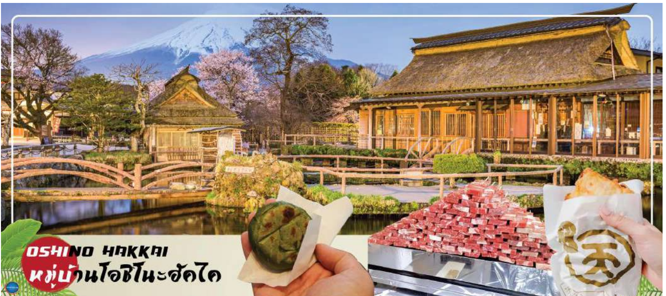
OSHINO HAKKAI หมู่บ้านโอชิโนะฮัคไค

ได้เวลาอันสมควรนำท่านเดินทางสู่ หมู่บ้านโอชิโนะฮัคไค (Oshino Hakkai) ให้ท่านเจาะลึกตามหาแหล่งน้ำบริสุทธิ์จากภูเขาไฟฟูจิ ที่เป็นแหล่งน้ำตามธรรมชาติตั้งอยู่ในหมู่บ้านโอชิโนะ จ.ยามานชิ หรือพูดในทางกลับกันคือกลุ่มน้ำผุดโอชิโนะฮัคไค เพียงก้าวแรกที่ย่างเท้าเข้าไปในหมู่บ้านก็สัมผัสได้ถึงอากาศบริสุทธิ์ และไอเย็นจากแหล่งน้ำธรรมชาติที่มีให้เห็นอยู่ทุกมุม โดยในบ่อน้ำใสแจ๋วมีปลาหลากหลายพันธุ์แหวกว่ายอย่างสบายอารมณ์ แต่ขอบอกเลยว่าน้ำแต่ละบ่อนั้นเย็นจับใจจนแอบสงสัยว่าน้องปลาไม่หนาวสะท้านกันบ้างหรือ เพราะอุณหภูมิในน้ำเฉลี่ยอยู่ที่ 10-12 องศาเซลเซียสนอกจากชมแล้วก็ยังมีน้ำผุดจากธรรมชาติให้ดื่มตามอัธยาศัย และที่สำคัญ หมู่บ้านโอชิโนะยังเป็นแหล่งช้อปปิ้งสินค้าโอท็อปชั้นเยี่ยมอีกด้วย